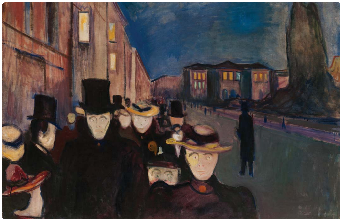
Edvard Munch: Aften på Karl Johan, 1892.

Edvard Munch: Aften på Karl Johan (1893-94). På en skremmende måte illustrerer bildet byens ensomhet og psykologiske fremmedfølelse. Trolig kan man se en parallell til det som sosiologen Durkheim i verket Le Suicide skulle gi navnet anomi.